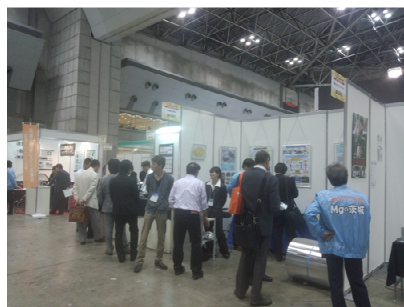
図 1 展示会場の様子

展示会ではマグネシウム合金の軽量性を生かしたカメラの筐体やスプレーガン等の製品、当センターで研究を進めているマグネシウム合金と異種金属の摩擦攪拌接合に関する研究成果を紹介しました。同時開催の機能材料・加工技術展等を含め 1 万人を超える来場があり、大変盛況でした。