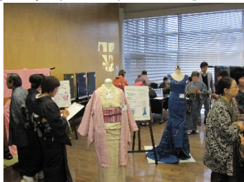
図 1 展示会場の様子

人気投票 No. 1 となった「着色防染染色法による結城紬」は「好きな色だから」「色が素敵だから」など「色」に関する理由で好まれる傾向がみられました。また、着物に関するアンケートを実施したところ将来着物を購入したいと思っている人は来場者の 8 割弱を占め、その際考慮するポイントとしては、「色・デザイン」はもちろんですが、「着心地や素材の良さ」を挙げる声も多く、着物を着る側の視点から意見を聞く貴重な場となりました。