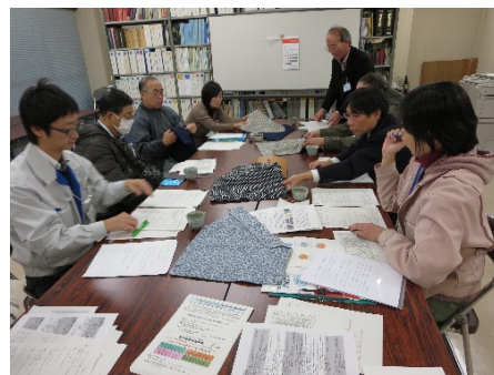
図 4 全体会合：第 3 回研究会の様子 【今後の活動予定】