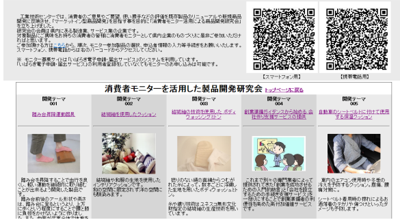
図 1 モニター募集サイト