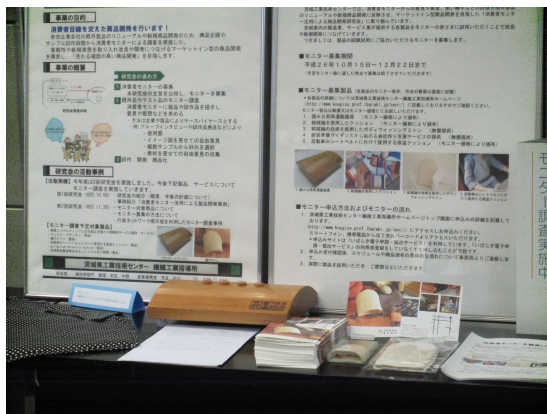
図 2 イベント会場でのモニター募集製品の展示