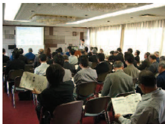
成果発表会 (工業・食品)