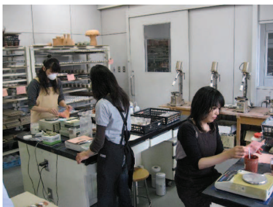
釉薬Ⅰ科 研修風景（自動乳鉢による釉薬調合）