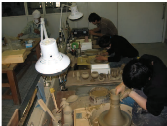
成形Ⅰ科 研修風景（ろくろ成形技術の習得）