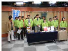
NHK地上波デジタル放送生出演