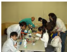
第7回全国中学生創造ものづくり教育フェア