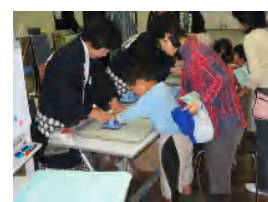
繊維工業指導所フェア