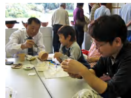
秋季匠工房笠間フェア